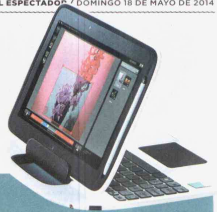
El dispositivo dos en uno pesa menos de 1 kg, está equipado con una pantalla de 10 pulgadas y tiene un procesador Intel® Atom™ Z3740D.