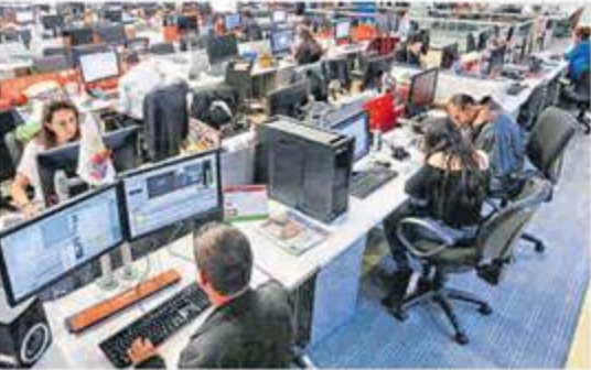
La evolución digital de este medio mantendrá a sus periodistas enfocados en atender mejor a sus audiencias.