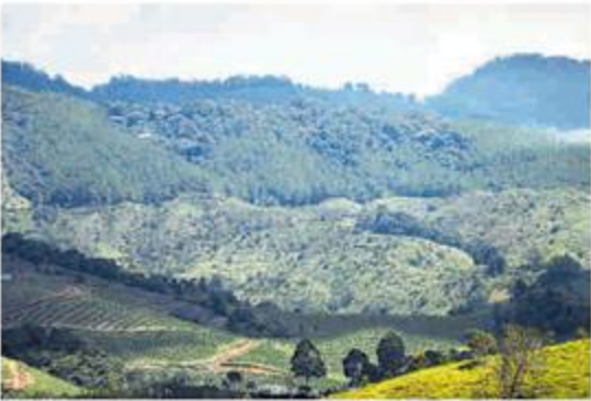
Hace 14 años AngloGold Ashanti está en Jericó buscando desarrollar el proyecto Quebradona.