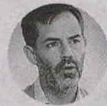
Julián Guerrero Orozco Viceministro de Turismo

"Las intervenciones en infraestructura y planta turística generan mayor valor a los territorios, mejoran la conectividad y la dotación de servicios de estos".