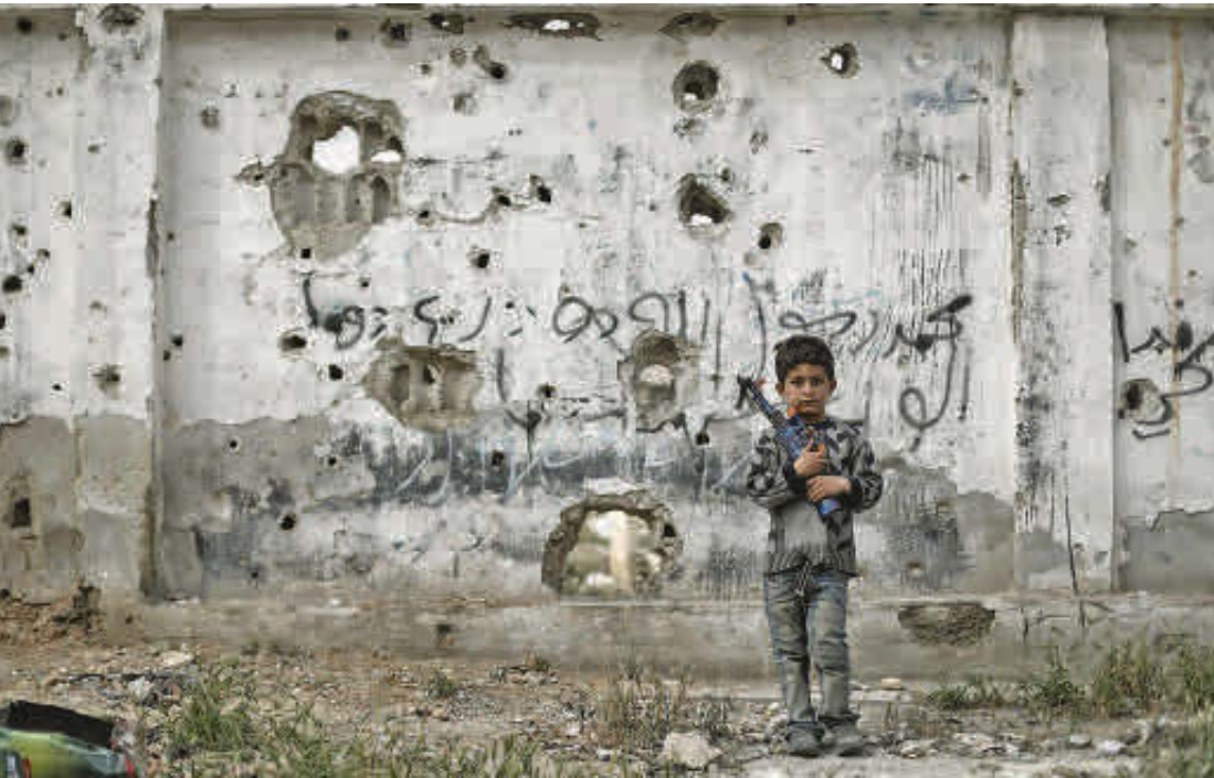
La participación de los niños en la guerra en Siria (foto) es una violación al Derecho Internacional Humanitario. Además, se ultrajan los derechos de los infantes y leyes de los países.

Fuente: Onu. Infografía: EL COLOMBIANO © 2019. CF (N4)