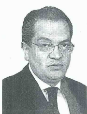
Fernando Carrillo, ministro del Interior.

"Lo que uno piensa es que si la Mesa de negociación va a terminar en noviembre o en diciembre, el mecanismo de referendación tendría que ser antes de las elecciones del Congreso", señaló.