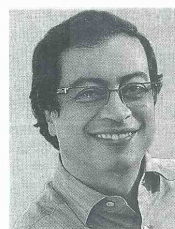
Gustavo Petro, alcalde.

También se conoció que la Registraduría Nacional le respondió al representante Miguel Gómez que Petro sí