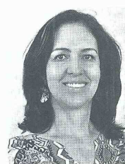
Ruth Stella Correa, ministra de Justicia.

Igualmente, dijo que "hay que pensar en una justicia restaurativa y no en una justicia retributiva, que es la que soporta el actual modelo penitenciario, la justicia restaurativa le apunta a pagar el daño, es mejor que el responsable pague lo que se robó, queda por