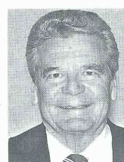
Joachim Gauck, presidente de Alemania.

Gauck proseguirá su visita hoy sábado en la ciudad de Medellín, donde participará en un seminario organizado por el Servicio Alemán de Intercambio Académico (Daad) junto a organizaciones defensoras