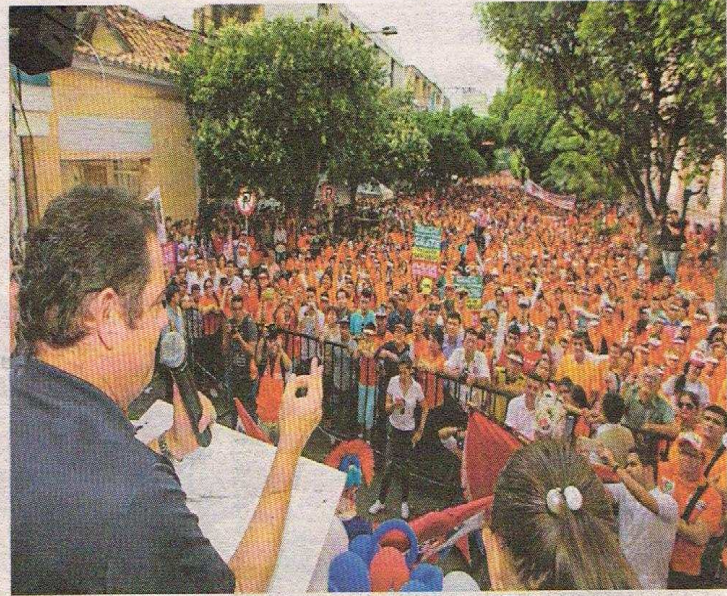
Germán Vargas Lleras en la zona industrial de Cúcuta. Asegura que reunió a cerca de 30 mil personas.

Germán Vargas Lleras y Gustavo Petro son los candidatos que más llenan las plazas públicas