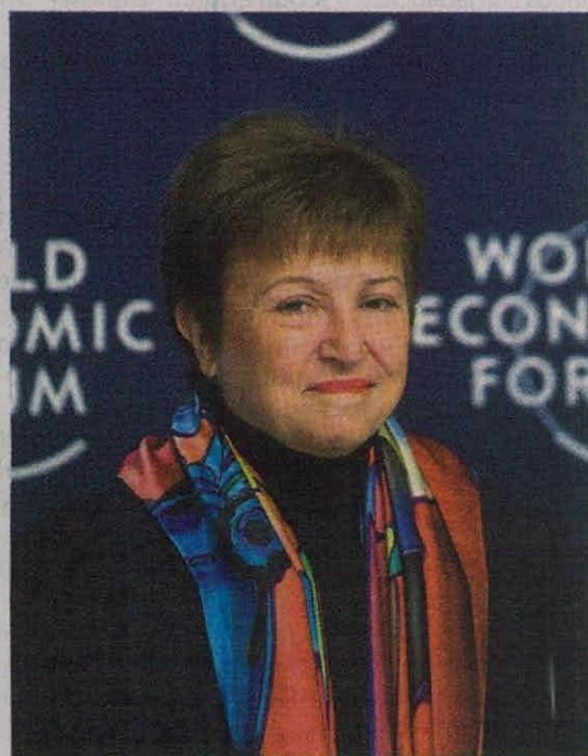
El Foro Económico Mundial está en cabeza de Kristalina Georgieva.