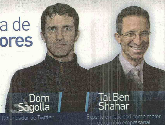
Dom Sagolla Cofundador de Twitter