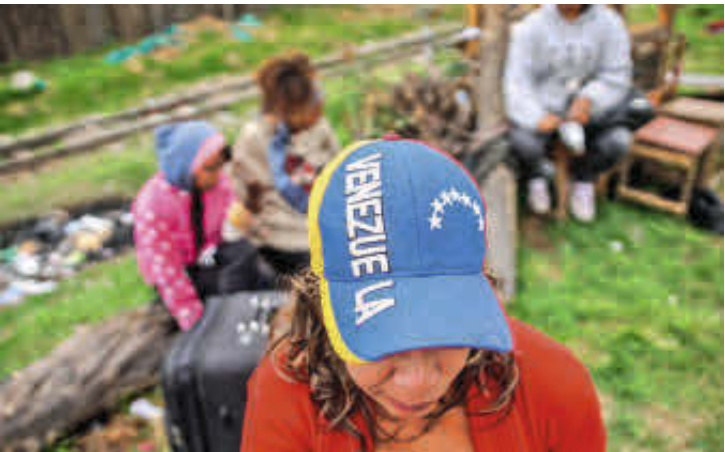
El inicio del éxodo masivo de venezolanos a Colombia data del año 2010. Desde entonces no ha decrecido.

Para el PhD en Ciencia Política y profesor de la Universidad Externado, Javier Garay, las midterms se dan en un contexto de “polarización y radicalización de las posiciones políticas en Estados Unidos”.