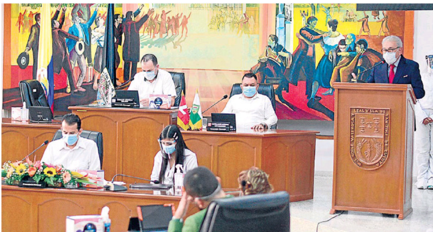
El Concejo de Cúcuta volvió a sesionar, ayer, de manera presencial, luego de varios meses en la virtualidad. El alcalde Jairo Yáñez instaló el tercer y último periodo