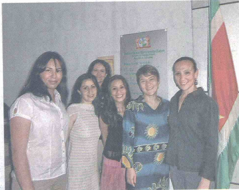
Aprendizaje. Estas mujeres se encargarán de enseñarles a los diplomáticos de Surinam a hablar español, ahora que lideran la presidencia de Unasur.