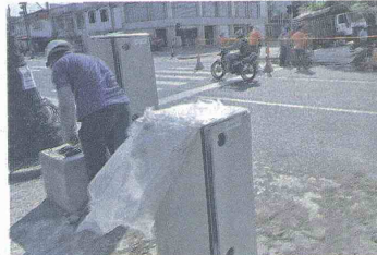
Roosevelt con 29. Este es uno de los diez puntos donde se instalarán nuevas cámaras de fotomultas esta semana.

Panesso agregó que, además de las 30 fotomultas que ya hay instaladas, se colocarán otras diez en los próximos días. Informó que algunas de ellas estarán ubicadas en: la Calle 6 (Roosevelt)