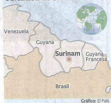
Gráfico: El País

que empaça las bolsas, hablan español", relata sorprendida. En las emisoras las entrevistan, como si fueran heroínas venidas de una tierra desconocida.