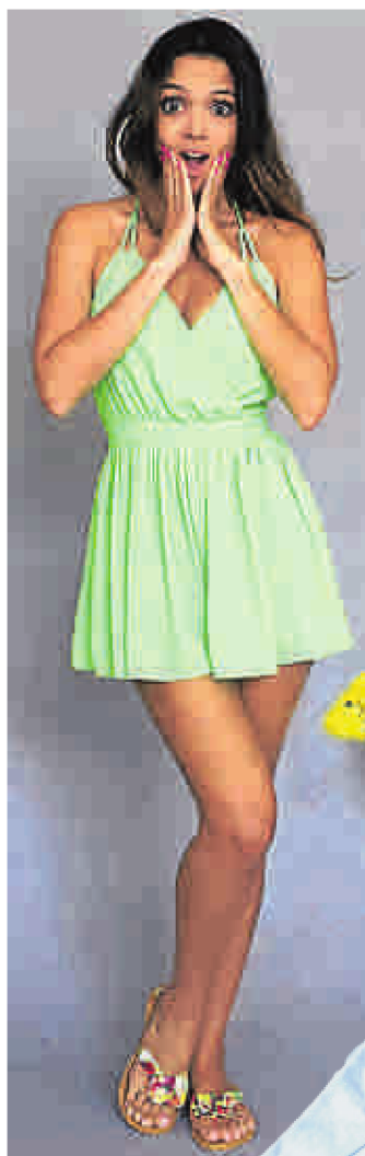
La María es una firma que homenajea el nombre de su creadora y de la Virgen.