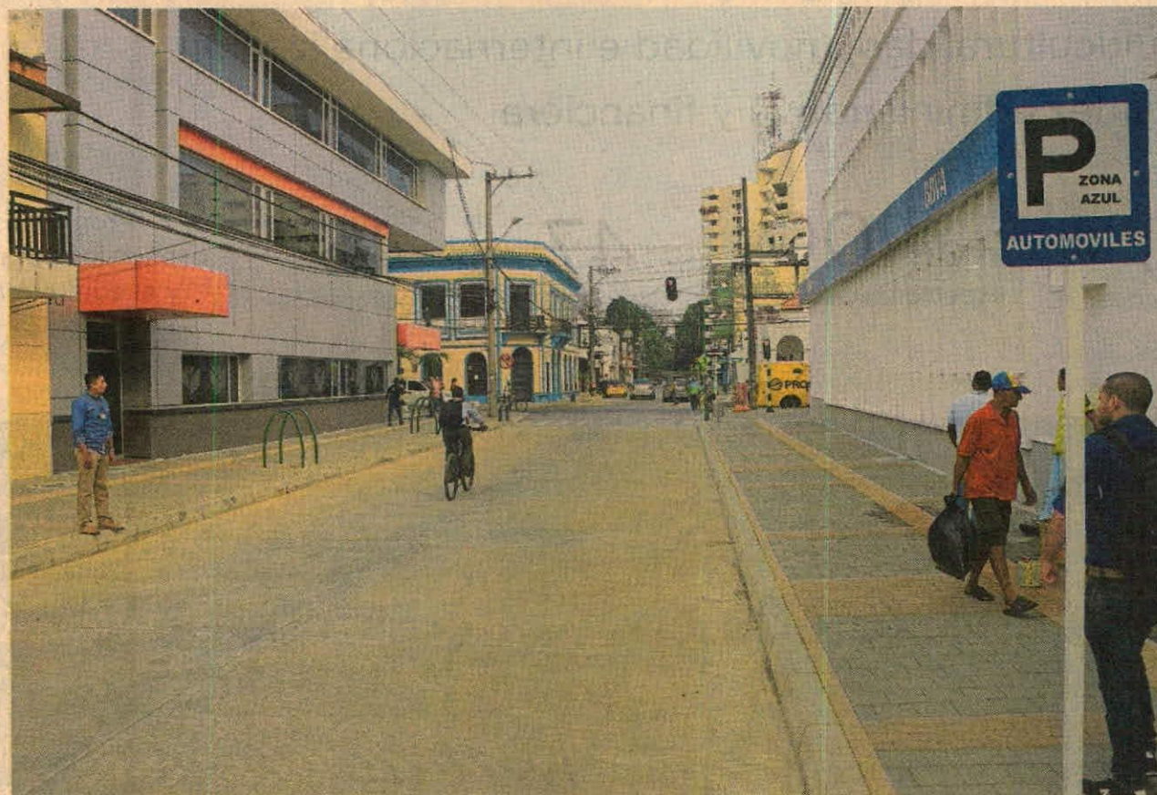
Los principales avances en la transformación de esta ciudad radican en la fortaleza de la inversión privada, medioambiente y comercio.