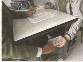
La percepción sobre incidencia de los sobornos ha aumentado en los últimos cuatro años.

tudio se consultaron en el 2012 a 853 empresarios, y entre sus conclusiones está que este delito es una práctica generalizada en los negocios. Cuando se les indaga cuáles consideran los empresarios en general como motivos de presión para dar u ofrecer sobornos, el 62 por ciento se identifica con la afirmación "si no pago sobornos pierdo negocios". En el 2010 llegó a 61 por ciento, y en el 2008 había sido 54 por ciento. El cumplimiento de metas es otro factor de presión para el 22 por ciento de los con-