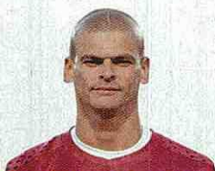
MIGUEL ÁNGEL CALERO