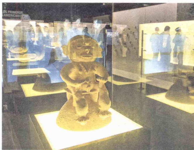
El Museo recibió la donación piezas arqueológicas de parte de las familias Oeding, Mangones, Maestre y Saint-Priest.

La exhibición tiene en escena más de 250 objetos de cerámica, hueso, piedra y oro, que permiten al visitante acercarse al complejo y diverso pasado de la región. Además, custodia más de 1.600 objetos arqueológicos,