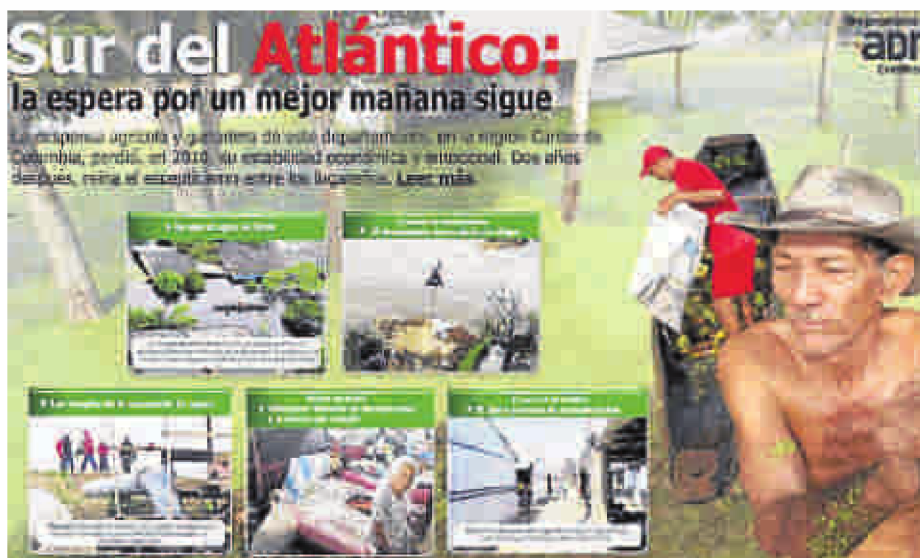
El especial web, que reúne galerías fotográficas, videos, textos, líneas de tiempo y mapas, se puede consultar en el sitio diarioadn.co .

Para la periodista Velásquez es necesario encontrar en su trabajo diario espacios que le permitan investigar y profundizar en los temas que la apasionan. "El sur del Atlántico es un tema que me mueve porque me parece inadmi-