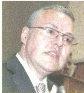
Néstor Iván Osuna