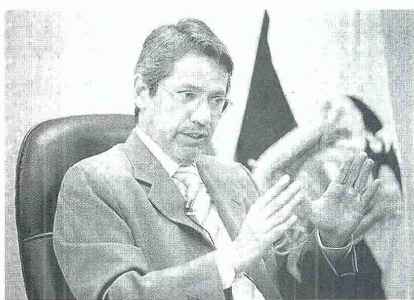
EL EMBAJADOR DE ECUADOR en Colombia, Raúl Vallejo, no tiene reparo en acusar a los medios de comunicación nacionales de crearle mala atmósfera al presidente Rafael Correa.

Según el diplomático, esos medios han confeccionado sus agendas informativas "casi exclusivamente con representaciones negativas del gobierno, de la realidad que vive el país y de la sociedad en su conjunto, incluso falseando la realidad y negándose