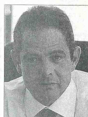
GERMÁN VARGAS LLERAS, Ministro de Vivienda, Ciudad y Territorio.

Este proyecto incluye la solución de vivienda a un estimado de 20 mil personas y