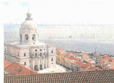
En el Panteón Nacional de Lisboa, que exhibe una hermosa arquitectura blanca, están sepultados los reyes de Portugal.

El premio, logrado por tercera vez en cinco años, supone un espaldarazo que aumenta "la visibilidad" de la capital lusa y genera un crecimiento en el flujo de turistas, concluyó Costa.