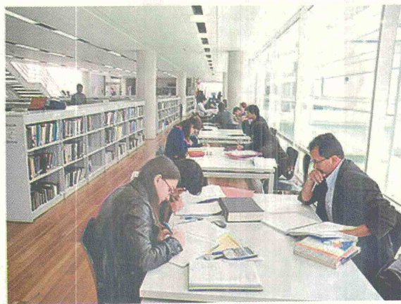
El 39 por ciento de los doctores graduados en el país son egresados de la UN.

doctorado, y el 39 por ciento de los doctores graduados en el país son egresados suyos.