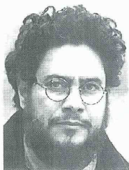
Iván Cepeda Castro, congresista.