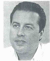
Juan Manuel Galán, senador.