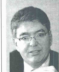
Mauricio Cárdenas, minhacienda.

De otra parte el ministro de Hacienda confió en una recuperación de la industria para el segundo semestre de este año. "Vamos a ver este segundo semestre con dinamismo y positivismo en el crecimiento de la industria".