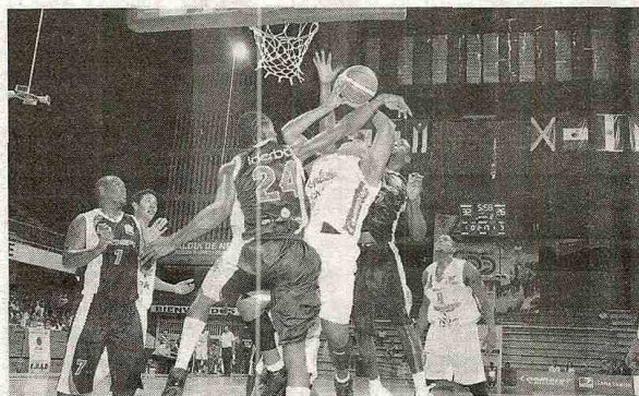
Un buen rendimiento presenta el equipo del Huila que se mantiene líder.

La historia es otra para la visita, los Halcones tienen un porcentaje de victorias de 0,187, el más bajo del campeonato.