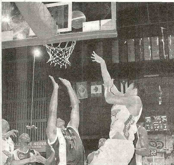
Un nuevo triunfo buscarán los jugadores de Bambuqueros en la Liga DirecTV de Baloncesto, esta vez frente a los Halcones de Cúcuta.