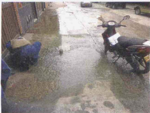
Hubo la necesidad de dejar sin agua a toda la ciudad para poder realizar estas reposiciones y así no desperdiciar más agua.