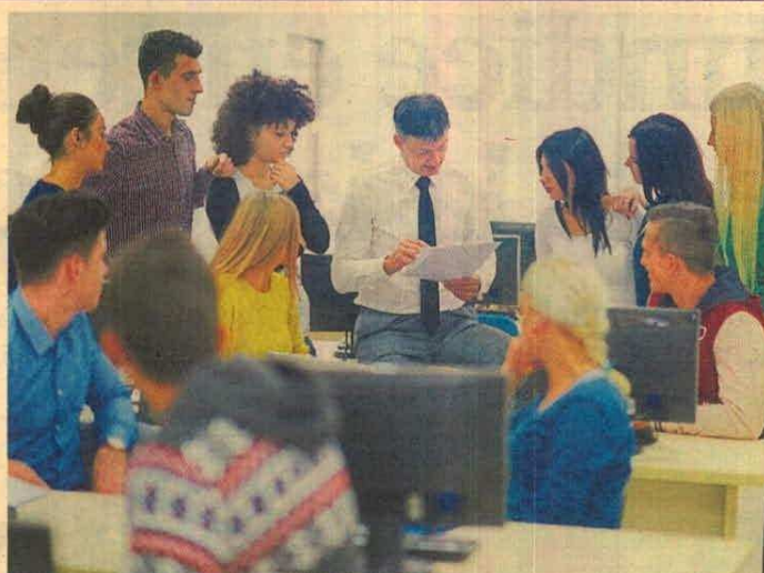
Una acreditación orienta a la institución educativa hacia la mejora continua en la formación de los estudiantes para garantizar su empleabilidad en un mercado laboral sumamente competitivo.

Las universidades con programas de Contaduría Pública galardonados con la acreditación de alta calidad del Ministerio de Educación Nacional, según el Sistema Nacional de Información de Educación Su-