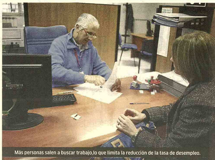
Más personas salen a buscar trabajo, lo que limita la reducción de la tasa de desempleo.

No obstante, los resultados de la Encuesta de Opinión Industrial Conjunta de la Andi y seis gremios ponen de presente que la revaluación ha afectado las exportaciones y los bienes que compiten con los importados con efectos nocivos en la ocupación (en julio-septiembre el empleo industrial cayó 0,5 por ciento).