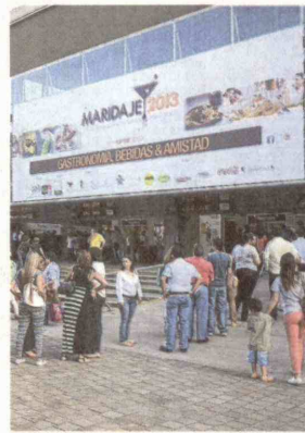
Cincuenta restaurantes participaron en Maridaje 2013, la feria de gastronomía de Medellín.

Esta edición tuvo otra novedad: la agenda académica, un 'regalo' para los interesados en gastronomía.