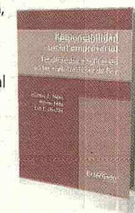
PEÑA & YEPES U. EXTERNADO $43.000

El libro contempla las distintas concepciones, corrientes y enfoques que han surgido en torno a la responsabilidad social empresarial, tema que ha adquirido relevancia a nivel internacional y aun cuando no se ha llegado a un consenso en su definición, el concepto ha evolucionado como parte integral del negocio de hoy.