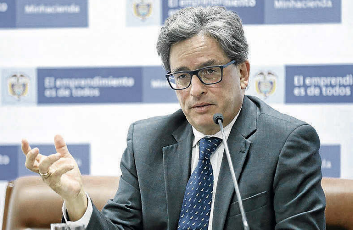
Ministerio de Hacienda

La Dirección de Impuestos y Aduanas Nacionales, en cabeza de José Andrés Romero , anunció que a través de la Policía Fiscal y Aduanera lograron la incautación de mercancía de contrabando por $1.500 millones. El operativo se realizó en el sector de Paloquemao, donde había una bodega de tres pisos que almacenaba 150.000 prendas de vestir, 160.000 cajetillas de cigarrillos y 300 pares de zapatos (AMS)