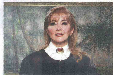
Ruth Marina Díaz Rueda, primera mujer nombrada presidenta de la Corte Suprema de Justicia.

nores y de Circuito de San Gil; fue nombrada como la primera mujer magistrada del Tribunal de San Gil, siendo escogida como la mejor magistrada de Colombia en 1993.