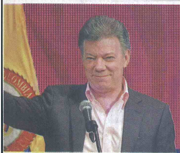
Juan Manuel Santos, presidente de la República.