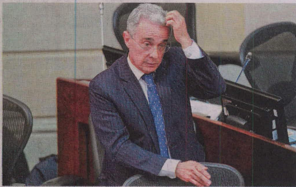
Álvaro Uribe fue presidente de Colombia en los periodos 2002-2006 y 2006-2010. En ambos fue elegido en primera vuelta y gobernó con enorme popularidad.

La explicación de Álvaro Uribe, expresidente, senador y líder del Centro Democrático (CD) a la imagen negativa que tiene entre los colombianos -66 por ciento, según la más reciente encuesta de Invamer- es que hay una generación de jóvenes que solo ha escuchado infamias contra él.