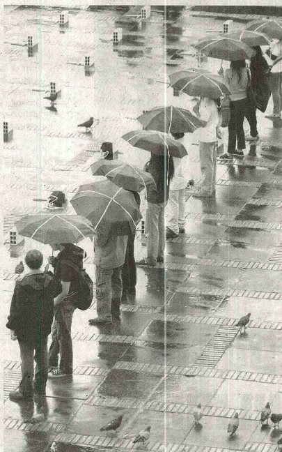
LA UNIDAD PARA LA Gestión del Riesgo de Desastres informó que 13 departamentos se han visto afectados por la primera temporada de lluvias del año.

En Tolima y Antioquia, la cifra de personas afectadas asciende a 300 en cada uno de los departamentos. En el primero hay hasta el