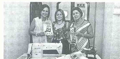
El programa de emprendimiento Hilos y Agujas

to tuvo la colaboración de las administraciones municipales de Pitalito y Neiva, así como el Servicio Nacional de Aprendizaje (Sena), que formó y capacitó cada uno de los alumnos que se inscribió y quienes finalmente salieron certificados por esta institución pública como técnicos de modistería.