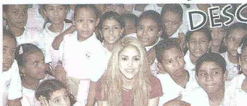
Como embajadora de buena voluntad de la ONU, Shakira es abanderada de la educación.

La construcción de este colegio, que tendrá cabida para mil 500 niños, se vio ralentizada por los cambios en la administración local, encargada de comprar los terrenos, pero según estimó Sierra, el colegio de Cartagena "se puede inaugurar a finales de 2013", y no descartó la presencia de Shakira en el acto.