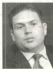
Juan Carlos Pinzón, mindefensa.

"No estamos de acuerdo con que por intereses políticos de un sector u otro traten de exacerbar situaciones donde lo único que hacen es enaltecer entre comillas los actos de criminalidad y de barbarie, eso no le conviene a Colombia y trasciende cualquier interés político", aseguró Pinzón, quien además dijo que lo que se debe hacer es negarles el espacio a