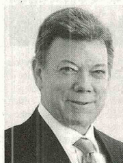
Juan Manuel Santos, presidente.

Aunque las cifras no lo favorecieron tanto en cuanto al camino por el cual va el país, la mayoría de los encuestados respondió que