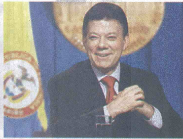
EL presidente, Juan Manuel Santos, se solidarizó con la dirigente política a través de su cuenta de Twitter. "Deseamos a Clara López una pronta recuperación. Esperamos tenerla de vuelta pronto en la arena política", publicó.