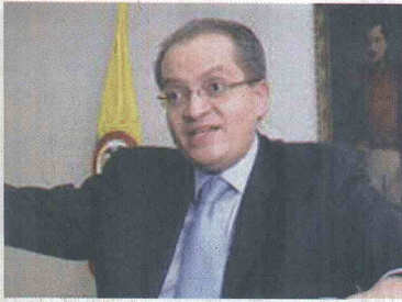
EL ministro del Interior, Fernando Carrillo, respondió al presidente del Congreso, Roy Barreras, que la paz debe estar lista antes de las próximas elecciones quien manifestó que el proceso iba a tardar más de lo que ha presupuestado por el Gobierno.