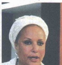
Piedad Córdoba Ruiz

Las elecciones presidenciales en Colombia están previstas para mayo de 2014, año en el que concluirá el periodo del gobernante Juan Manuel Santos, en cuya gestión Venezuela y Colombia recomposieron sus relaciones tras una crisis diplomática y com