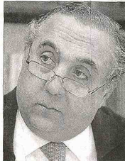
FEDERICO RENJIFO, ministro de Minas y Energía