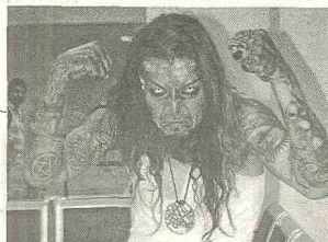
Figura del día