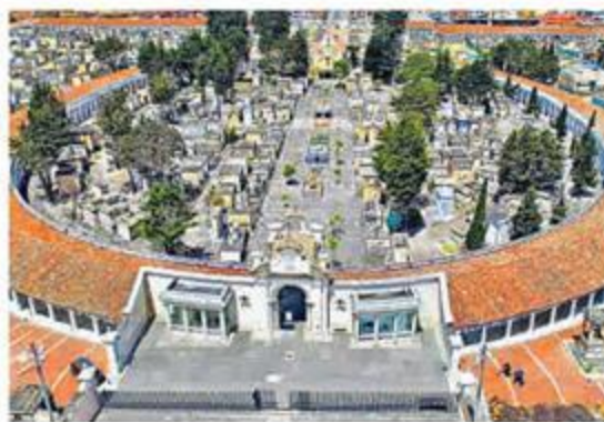
El concesionario de los cementerios públicos garantizará que a los residuos se les dé el debido manejo y disposición.

Una vez ingrese al cementerio un caso asociado, el administrador deberá diligenciar un formato en el cual se especifiquen datos relevantes que permitan documentar la atención. Así se delimitará la ruta de ingreso del cuerpo entre el vehículo y el horno, evitando que se acerquen deudos o personas que no tengan que ver