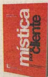
MARTA LUCÍA RESTREPO S. DEL HOMBRE EDITORES EBOOK