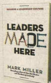
MARK MILLER BERRETT-KOEHLER PÁGS. 144