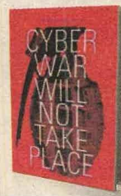
THOMAS RID H. PUBLISHERS PÁGS. 218

•Cómo afectan los ciberataques al sabotaje y al espionaje. •Qué deben hacer los gobiernos en lugar de centrarse en tomar la ofensiva en los ciberataques.