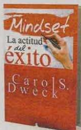
CAROL DWECK SIRIO PÁGS. 336