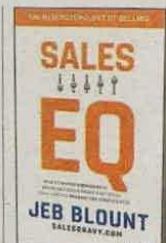
JEB BLOUNT WILEY PÁGS. 320