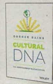
GURNEK BAINS WILEY PÁGS. 320