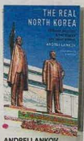
ANDREI LANKOV OXFORD UP PÁGS. 336

SÍGANOS EN: asuntoslegales.com.co Con información sobre el pleito marcarlo de Sodimac con Car Center en la SIC.