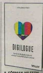
A. SORMAN-NILSSON WILEY PÁGS. 288