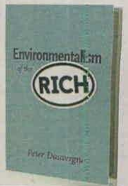
PETER DAUVERGNE MIT PRESS PÁGS. 232