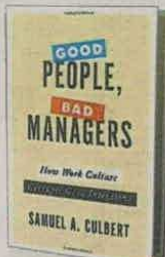
SAMUEL A. CULBERT OXFORD UP PÁGS. 208