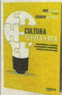
ROTHER, AULINGER PROFIT PÁGS. 219

• ¿Cómo responder al cambio en la era digital?