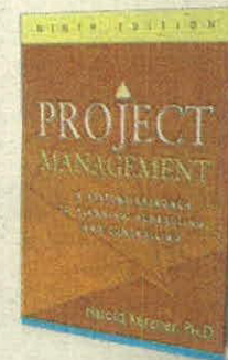
HAROLD KERZNER WILEY PÁGS. 1040

•¿Por qué el liberalismo europeo ha caído?