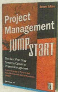
KIM HELDMAN JOSSEY-BASS PÁGS. 352