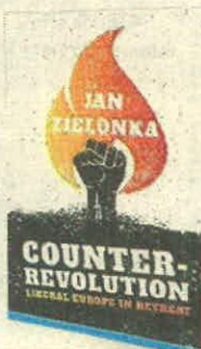
JAN ZIELONKA OXFORD UP PÁGS. 176

•¿Qué implica la nueva visión de Xi Jinping para China?