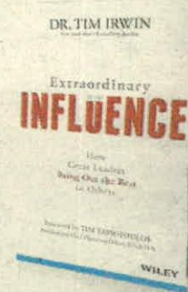
TIM IRWIN WILEY PÁGS. 208