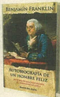
BENJAMÍN FRANKLIN TALLER DEL ÉXITO PÁGS. 168