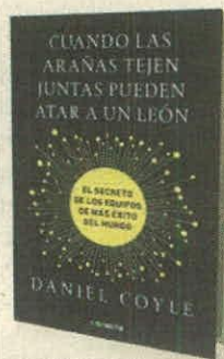
DANIEL COYLE CONECTA PÁGS. 250

• ¿Cómo no hay una única fórmula para el éxito y cuáles son las alternativas?