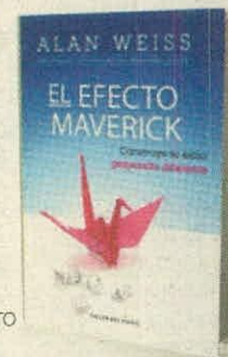
ALAN WEISS TALLER DEL ÉXITO PÁGS. 225

asuntoslegales.com.co Para leer sobre el pleito de marcas que involucró a la Whisky Association.