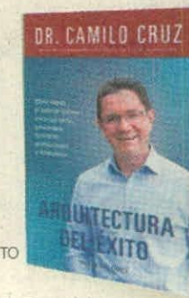
CAMILO CRUZ TALLER DEL ÉXITO PÁGS. 213

• ¿Cómo articular mejor el trabajo con el del equipo para lograr grandes cosas?