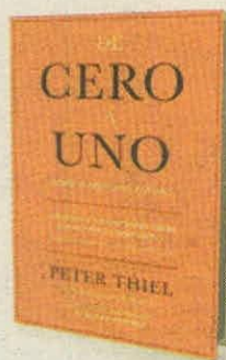
PETER THIEL GESTIÓN 2000 PÁGS. 200

• ¿Cómo enfrentar el trabajo diario y de paso, asumir la responsabilidad del éxito, entendiendo que somos nuestros propios gestores?