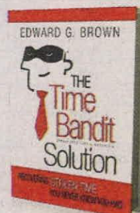
EDWARD G. BROWN GREENLEAF BOOK GROUP PÁGS. 248