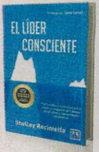
SHELLEY RECINIELLO LID EDITORIAL PÁGS. 208