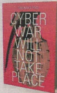
THOMAS RID HURST PUBLISHERS PÁGS. 218