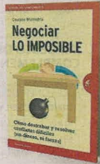
DEEPAK MALHOTRA EDICIONES URANO PÁGS. 220

• Conocer los desafíos de seguridad a los que se enfrentan los países por la tecnología.