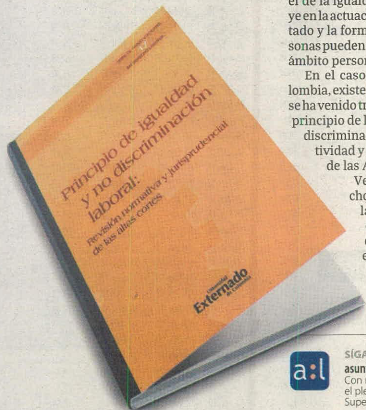
VARIOS AUTORES U. EXTERNADO PÁGS. 262

BOGOTÁ_ Dentro de los derechos de los ciudadanos se encuentra el de la igualdad, el cual influye en la actuación directa del Estado y la forma en que las personas pueden relacionarse en el ámbito personal y laboral.