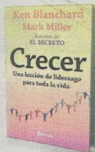
VARIOS AUTORES BERRETT-KOEHLER PÁGS. 144