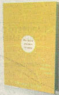
THOMAS HURKA OXFORD PÁGS. 200