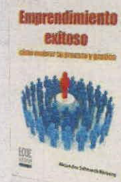
ALEJANDRO SCHNARCH ECOE PÁGS. 238

• Iniciar un negocio rentable a pesar de no tener un capital suficientemente alto.