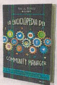
MANUEL MORENO DEUSTO PÁGS. 354

• Manejo apropiado de las redes sociales para impulsar su marca.