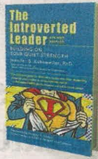
JENNIFER B. KAHNWEILER BERRETT-KOEHLER PÁGS. 216