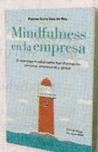
VARIOS AUTORES ZENITH EDITORIAL PÁGS. 256